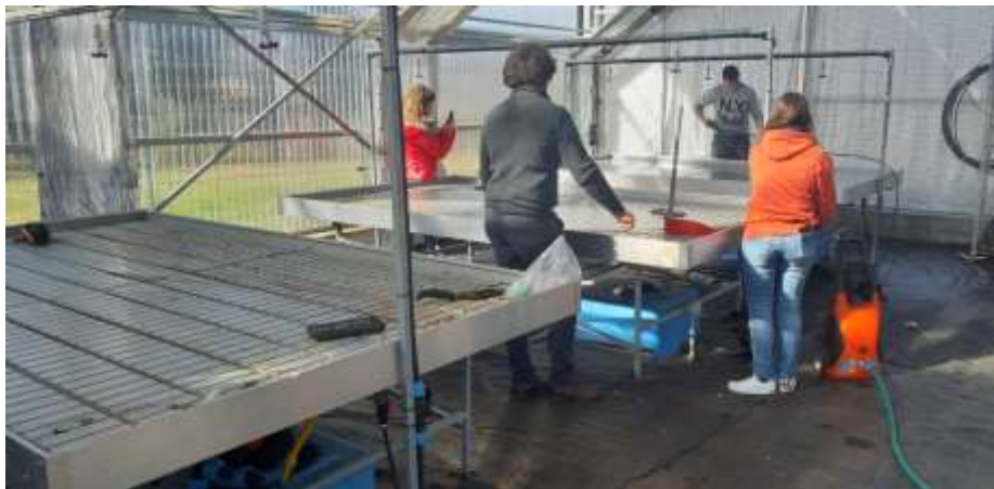
Figura 4: Esercitazioni di laboratorio nella serra della scuola