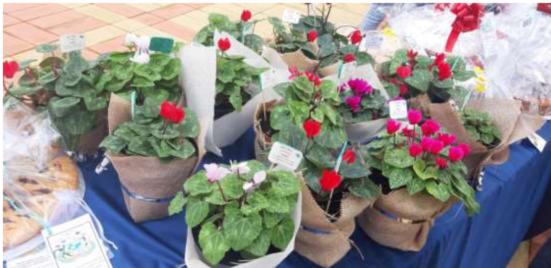
Figura 6: Piantine realizzate nella serra dell'IPSASR per l'UNICEF