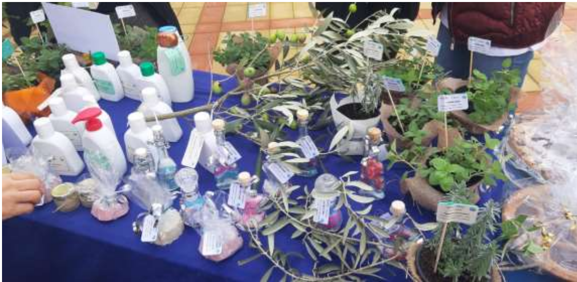
Figura 5: Saponi e cosmetici all'olio di oliva realizzati nel laboratorio dell'IPSASR per l'UNICEF