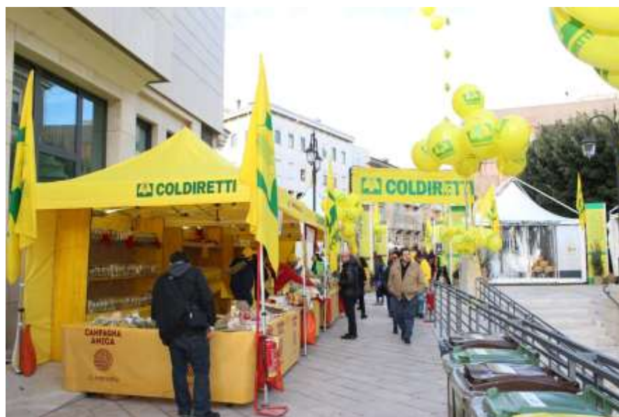
Figura 2: Villaggio rurale (Matera)