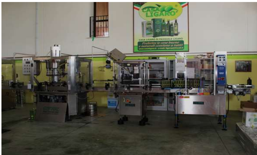
Figura 1: Impianto imbottigliamento olio di oliva Azienda Casa Ligarò