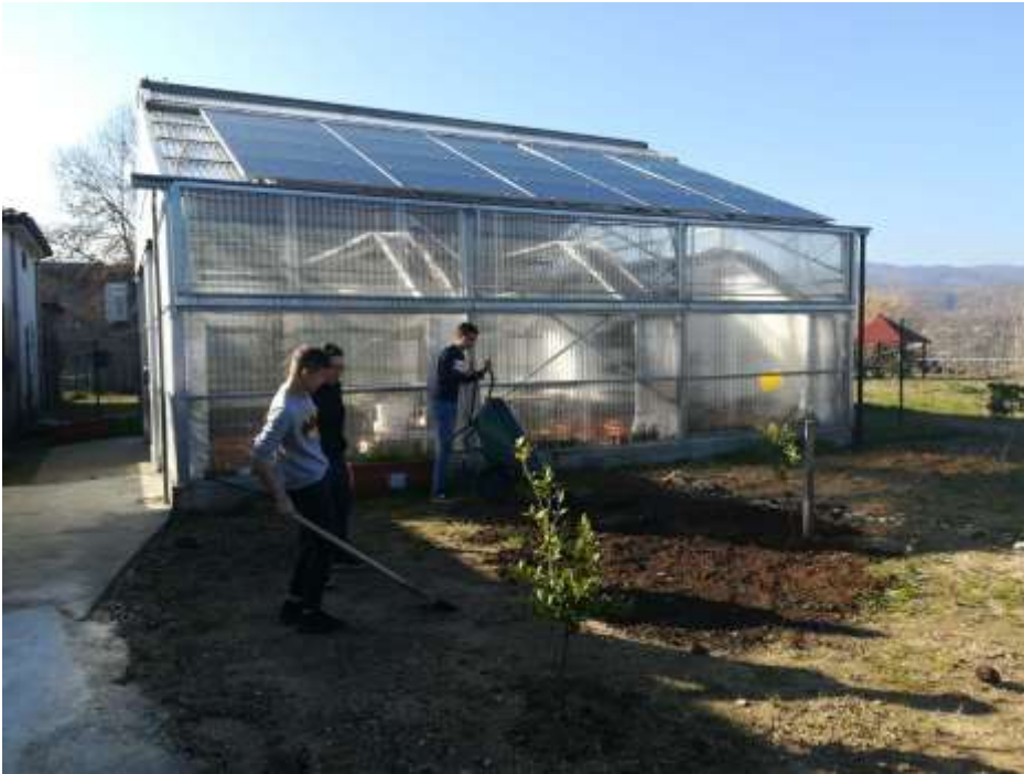
Figura 3: Esercitazioni di arredo verde nella sede dell'IPSASR